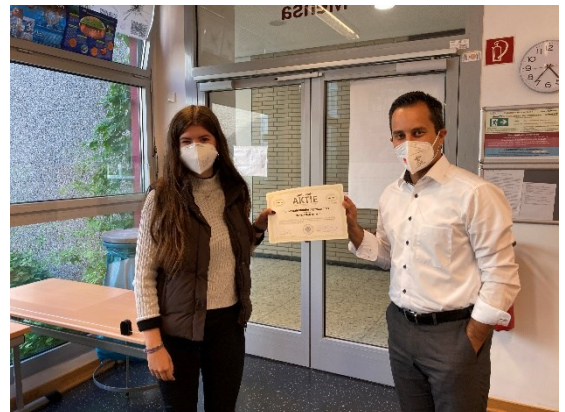
Abbildung 2: Mahmut Özdemir MdB

Die Teilnahme wurde uns durch den erneut gewählten Bundestagsabgeordneten Mahmut Özdemir ermöglicht, der durch den Erwerb einer Demokratie-Aktie die Finanzierung übernahm.