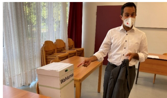
Abbildung 6: Mahmut Özdemir MdB