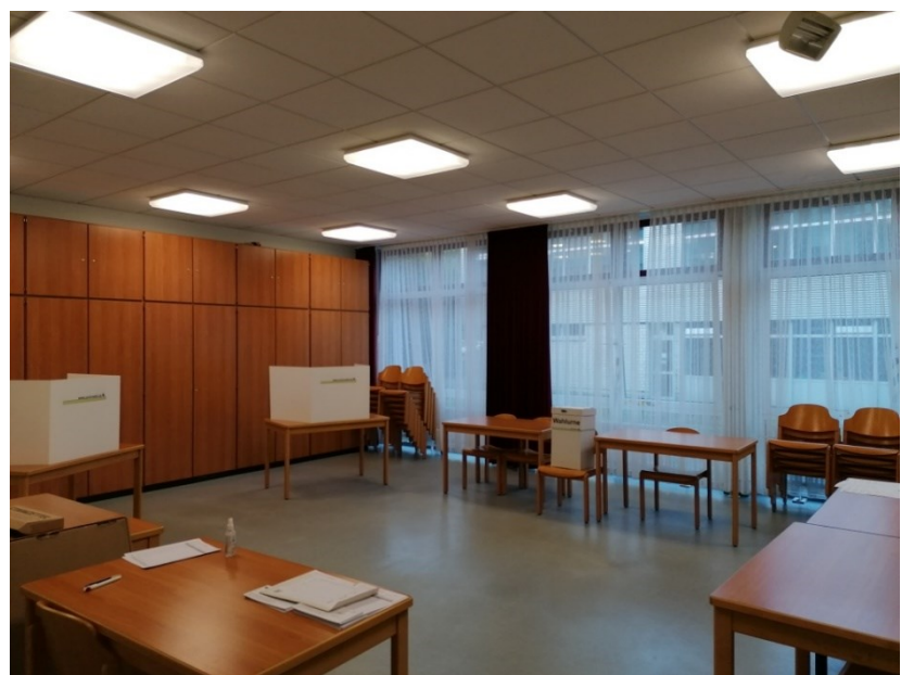
Abbildung 7: Ovk